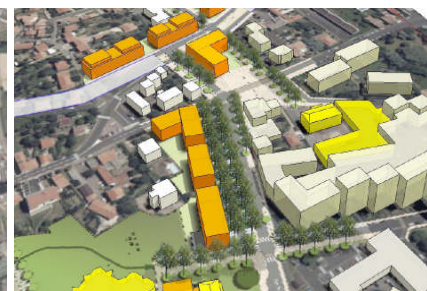
Vue 3D du Mail Planté sur la rue de l'Hôtel de Ville