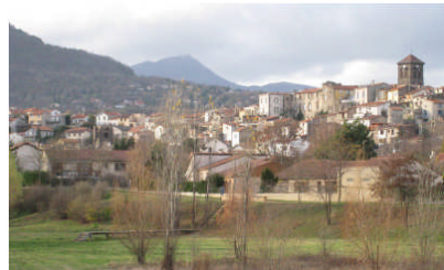
Centre bourg de Beaumont