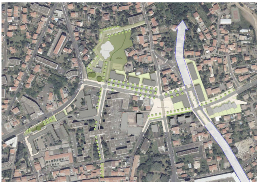
Plan de référence du projet d'aménagement