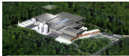
Unité de valorisation par méthanisation (OVADE)