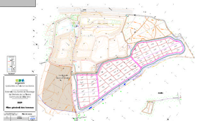
Plan général des travaux