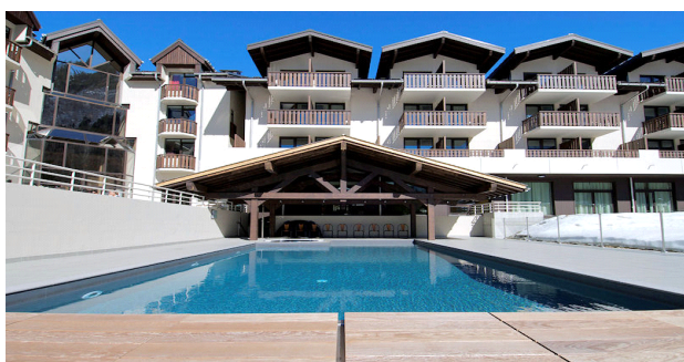
Piscine de l'Hôtel Les Aiglons, tempérée par une chaudière biomasse