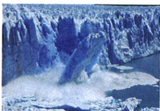
Disparition de la banquise arctique pérenne