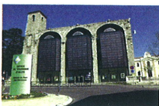
Agenda 21 du Grand Alès