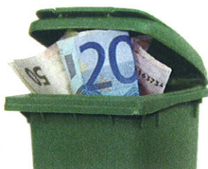
Réduction des déchets