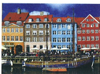
Copenhague, conçue pour la vie